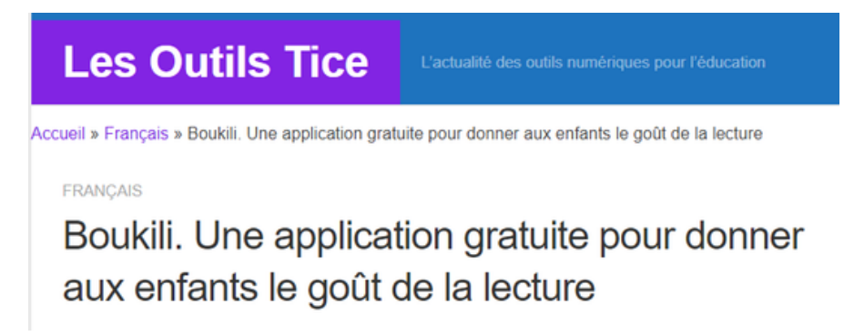
Un article de présentation complet de la plateforme