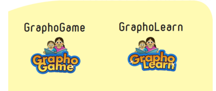
Le manuel d'utilisation de graphogame