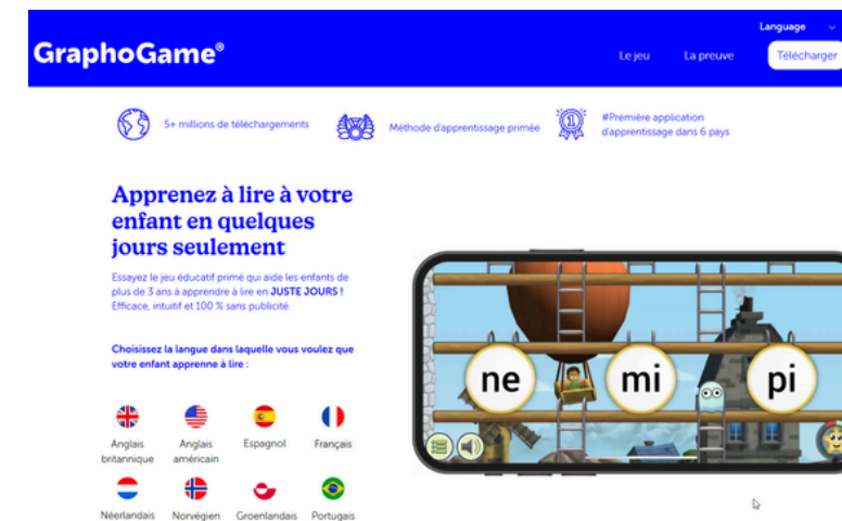
Le site de graphogame

Graphogame est une application d'entraînement permettant d'automatiser le décodage chez les élèves de fin de GS et CP. Le jeu introduit progressivement les graphèmes, les syllabes, les mots puis les phrases. Grâce aux répétitions des correspondances graphophonologiques, l'enfant va acquérir des réflexes qui amélioreront son processus de décodage