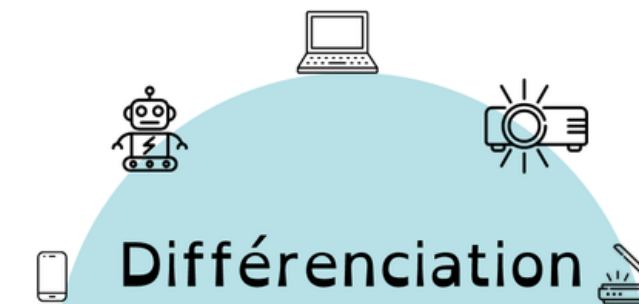
Le guide réalisée par l'équipe numérique 87