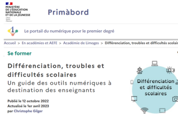
La page de Primabord

Retrouvez sur Primabord « Différenciation, troubles et difficultés scolaires », un guide des outils numériques à destination des enseignants, visant à offrir une sélection d'outils numériques adaptés à l'accompagnement des élèves qui rencontrent des difficultés dans leurs apprentissages.